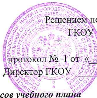
Таблица – сетка часов учебного плана адаптированной основной общеобразовательной программы по ФГОС I вариант, для обучающегося 5,7 классов по индивидуальной программе (по выбору) на дому на 2022-2023 учебный год